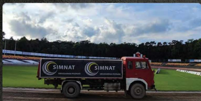
Reklama na pojazdach służb technicznych - ciągniki, flagi