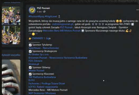
Artykuł sponsorowany na Fb oraz www