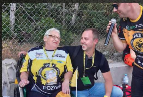
Możliwość przeprowadzenia akcji promocyjnych przed i podczas meczu