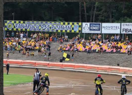
Tablice reklamowe - korona stadionu