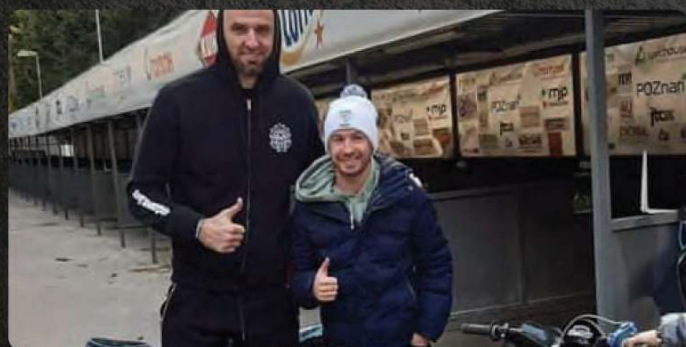
Możliwość wejścia do Parku Maszyn