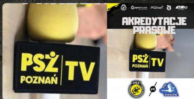
Pakiet sponsora PSŻTV