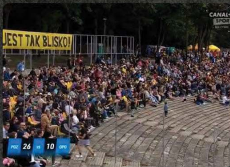
Transmisje TV Canal+ Sport 5