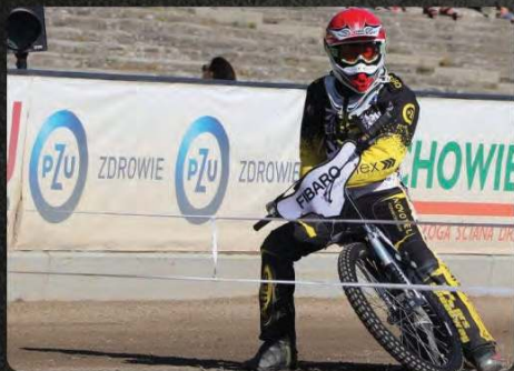
Reklama na bandzie toru żużlowego