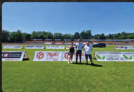
Wybrany pakiet reklam – ekspozycja stała