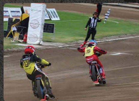
Słupek maszyny startowej/ zegar 2 min