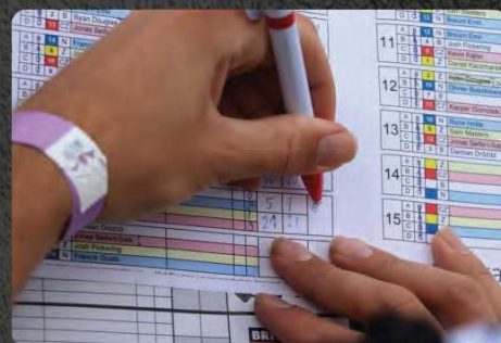
Sponsor 15 biegu