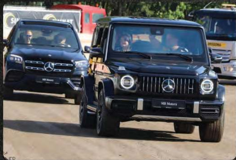
Wyjazd autem firmowym na prezentację

Cena pakietu od 10.000 zł, w ramach pakietu m.in.: