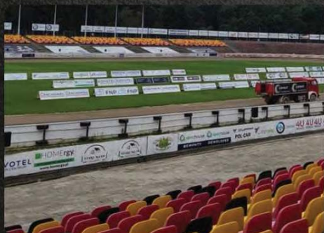
Branding reklamowy od strony trybun