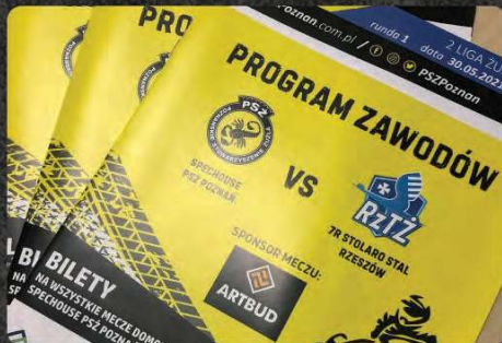
Logo na pierwszej stronie w programie z dopiskiem sponsor meczu