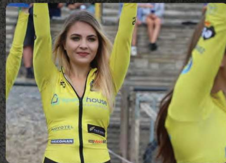
Reklama Grid Girls