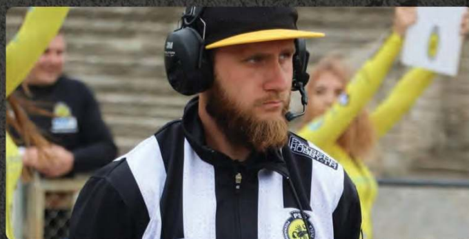
Czapka kierownika startu