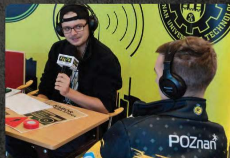
Zajawka meczowa z nazwą sponsora (emisja u partnerów radiowych)