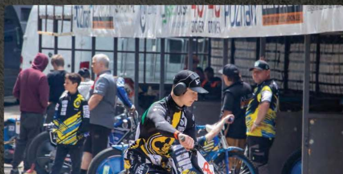
Brama parku maszyn (może być pneumatyczna)