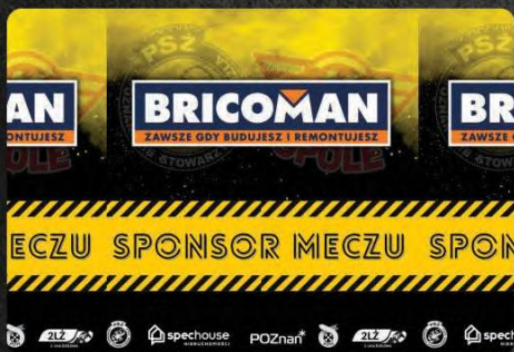
Logo na plakacie z dopiskiem sponsor meczu