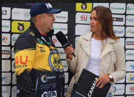
Reklama (Press wall, ścianka prasowa)