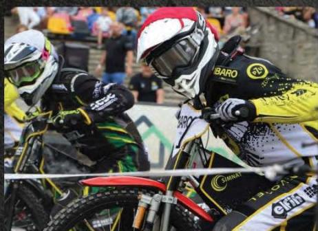
Reklama taśma startowa