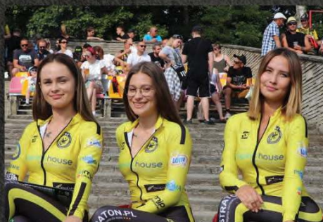
Pięciokrotna ekspozycja banneru przez hostessy, w tym do prezentacji