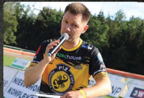
Komunikaty spikerskie podczas rzezonego spotkania