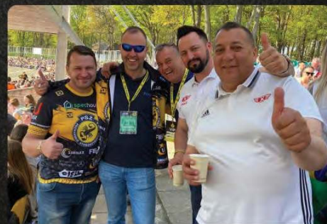
Pakiet VIP & Hospitality